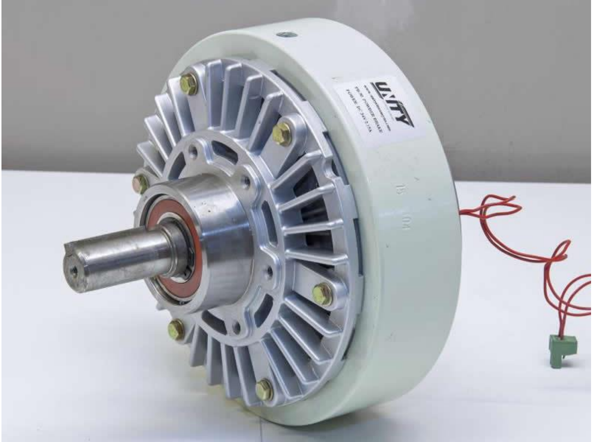
Şekil 1. UTF-M serisi manyetik tozlu fren.